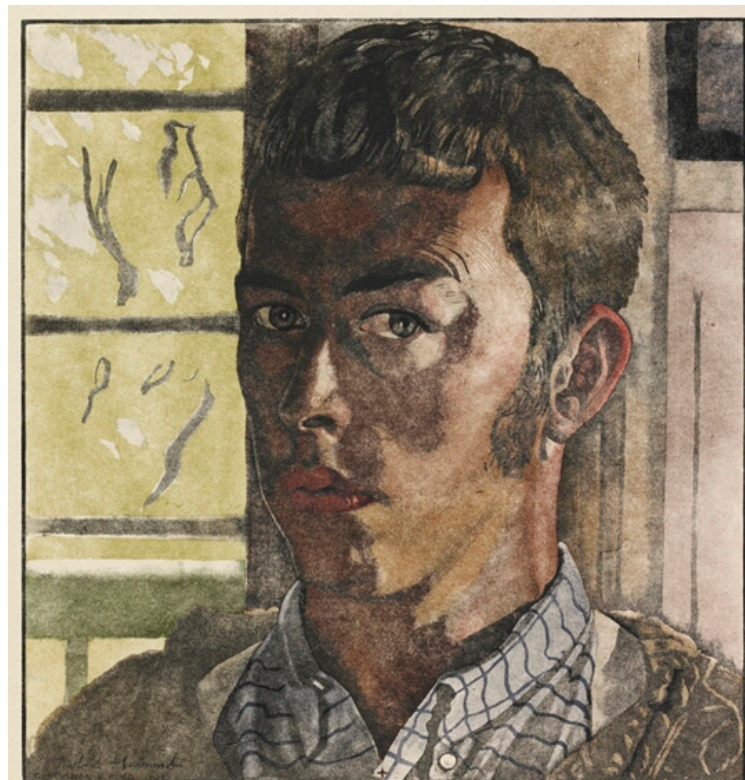
Robert Hainard. Autoportrait. 1937. Gravure sur bois n° 76. 22 x 21 cm. © Fondation Hainard.

Nous avons tous ressenti par l'observation cette altérité de la plante ou de l'animal : perception par d'autres sens, différences vertigineuses de vitesse et de processus de développement, codes comportementaux déroutants... Nous ne retenons qu'avec difficulté la tentation de projeter nos propres codes sur ces êtres étranges, mais ressentons par l'esprit et le corps l'impossibilité de cette transcription.